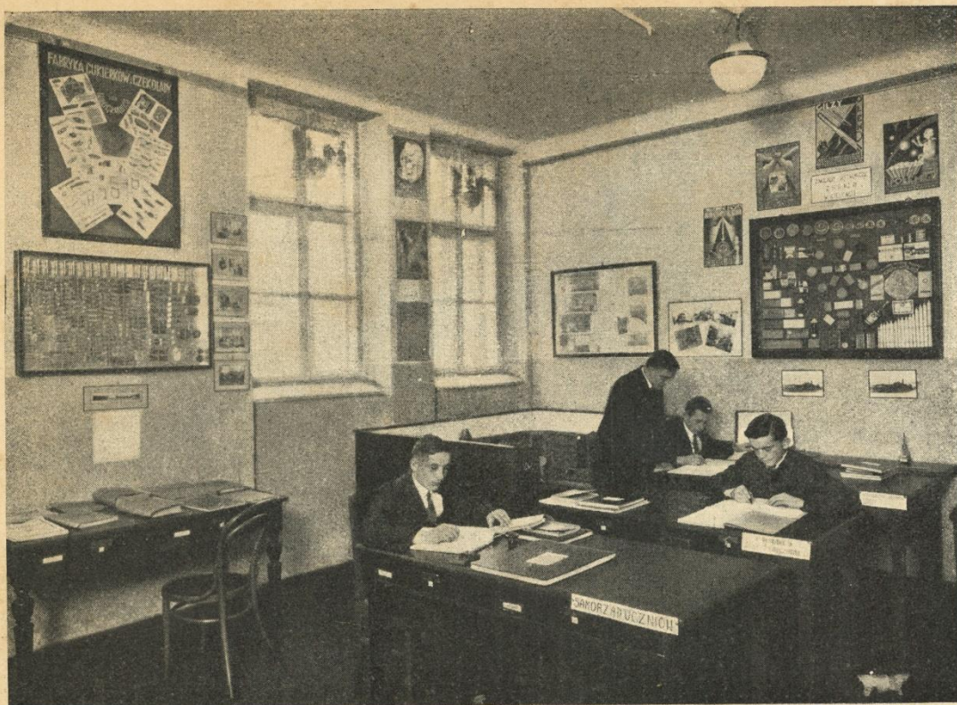
SALA ZAJĘĆ PRAKTYCZNYCH, W KTÓREJ UCZNIOWIE M I. ĆWICZĄ SIĘ W SAMODZIELNEM PROWADZENIU RACHUNKOWOŚCI NA PODSTAWIE MATERJAŁÓW SWOICH INSTYTUCYJ UCZNIOWSKICH: SPÓŁDZIELNI, KASY OSZCZĘDNOŚCIOWO-POŻYCZKOWEJ I SAMORZĄDU POD KIERUNKIEM NAUCZYCIELA P. ALEKSANDRA LIPY.