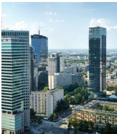
Ponad 100 tys. mieszkań w 100 spółdzielniach w Warszawie ma nieuregulowany stan prawny.

Do końca 1997 r. regulacja stanu prawnego gruntów na rzecz spółdzielni mieszkaniowych odbywała się na podstawie art. 88a ustawy o gospodarce gruntami i wywłaszczaniu nieruchomości. Natomiast od 1 stycznia 1998 r., tj. od daty wejścia w życie ustawy o gospodarce nieruchomościami, regulacja odbywa się na podstawie art. 207 i 208 tej ustawy. Jak widać ciągłość procedur zmierzających do ustanowienia na rzecz spółdzielni mieszkaniowych prawa użytkownika wieczystego została przez ustawodawcę zachowana, a co za tym idzie rozszczenia spółdzielni w tym zakresie w dalszym ciągu istnieją i są w pełni uza-