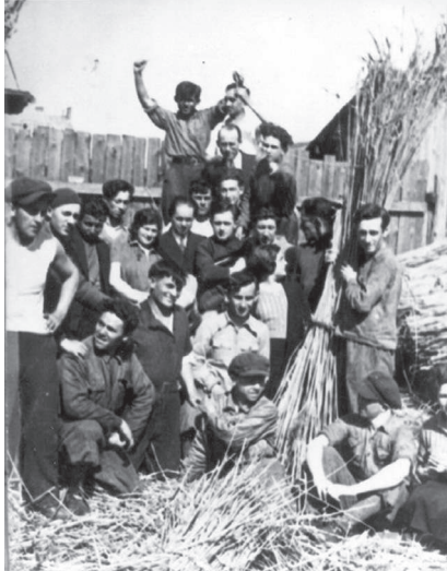
Pionierzy z organizacji He-Chaluc Warszawa 1934 r.

„Chaluce” kształcili się nie tylko w zakresie rolnictwa. Organizowano zajęcia z nauki języka hebrajskiego, geografii Palestyny, a także szkolenia ideologiczne na temat syjonizmu czy socjalizmu. Kwitło życie kulturalne, które wykraczało poza bramy kibucu, trafiając do wielu środowisk syjonistycznych w Warszawie. Działał chór, orkiestra, amatorski teatr. Żydowską młodzież ze stolicy przyciągały odbywające się w piątki i soboty zabawy taneczne. Spółdzielnię odwiedzali prominentni goście, żydowscy artyści, intelektualiści i działacze, wśród nich twórca współczesnej poezji hebrajskiej Chaim Nachman Bialik czy przyszła premier Izraela Golda Meir. W okresie kryzysu gospodarczego, gdy kibuc szukał