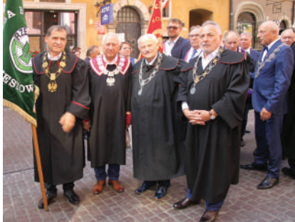
Przedstawiciele Zarządów Izb i Cechów Rzemieślniczych.

W dniu 12 września br. odbyła się uroczystość 90-lecia działalności Związku Rzemiosła Polskiego. Z tej okazji w siedzibie Związku miała miejsce uroczysta gala pod Honorowym Patronatem Prezydenta RP Andrzeja Dudy.