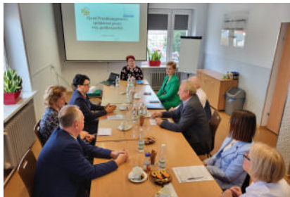
Zjazd regionalny w Rzeszowie

W dniach 2 i 3 października br. zjazdy regionalne odbyły się także w Rzeszowie