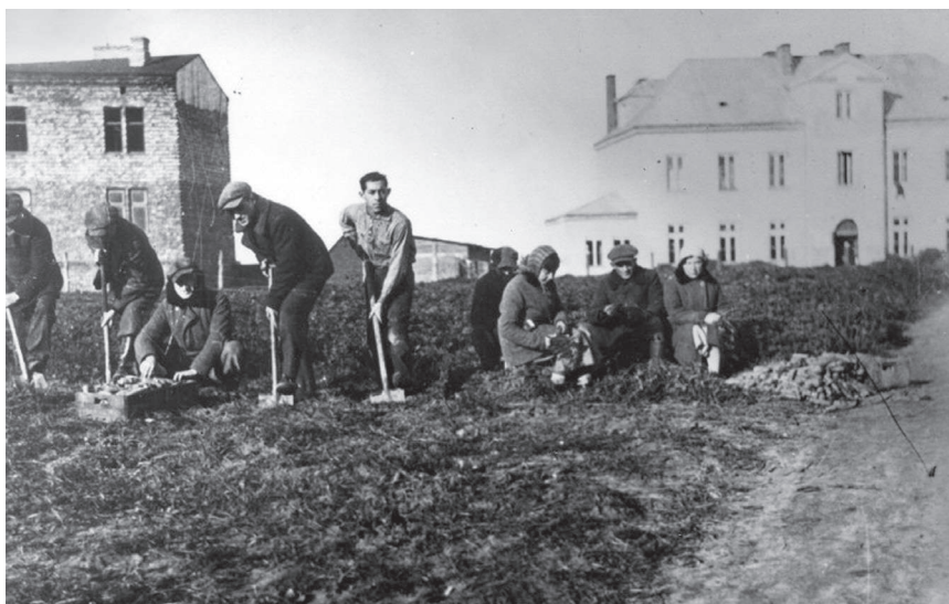
Pionierzy z organizacji He-Chaluc podczas zakładania ogródka warzywnego w kibucu na Grochowie, Warszawa 1934 r.

Jedziesz tramwajem nr 24 z centrum miasta na wschód. Wsiadasz na przedostatnim przystanku, już prawie na wsi. Wokół zieleń, pola, łąki, niewielkie zabudowania. Jeszcze krótki marsz gruntową drogą i stajesz przed nieco większym piętrowym budynkiem, przy którym kręcą się młodzi ludzie w roboczych strojach z rolniczymi narzędziami. Mieści się tu siedziba... kibucu. Czy to obrazek z Tel Awiwu bądź Jerozolimy? - bo z Izraelem przecież kojarzy się ta specyficzna forma spółdzielni. Ale nie, to przedwojenna Warszawa! Przed nami słynny warszawski Kibuc Grochów, ważne