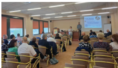
Spotkanie Klubu Prezesa i Głównego Księgowego w Krakowie

1 lipca hasłem „Spółdzielnie budują lepszą przyszłość dla wszystkich” zorganizowano spotkanie Klubu Prezesa i Głównego Księgowego. W spotkaniu uczestniczyli przedstawiciele spółdzielni z różnych branż, zrzeszonych i niezrzeszonych w Związku Lustracyjnym Spółdzielni z województw małopolskiego i śląskiego, a także przedsiębiorcy, przedstawiciele spółdzielni uczniowskich oraz innych podmiotów współpracujących ze spółdzielczością.