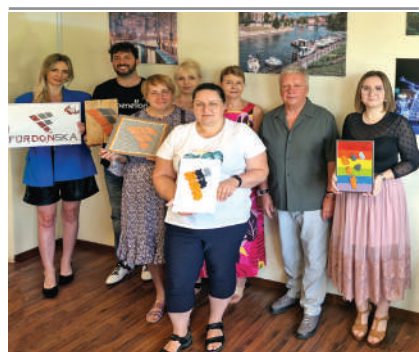
Pracownicy Fordońskiej SM z prezentują swoje prace w towarzystwie członków Zarządu FSM