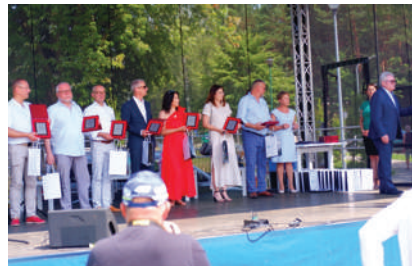
„Samorządowcy-Spółdzielcy” uhonorowani wyróżnieniami podczas uroczystości.

znaką Spółdzielczość Polska”. 19 osób otrzymało także odznaczenia „Zasłużony Działacz Ruchu Spółdzielczego”. Jak stwierdził: - Spółdzielczość to polskie dziedzictwo gospodarcze, które należy pielęgnować i którym trzeba się chwalić. Piknik jest okazją do pokazania dorobku spółdzielczego, który w Polsce jest szczególnie bogaty.