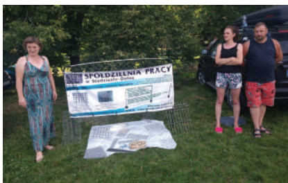
Spółdzielnia Pracy w Studzianie-Dolne zaprezentowała siatki ogrodzeniowe własnej produkcji.