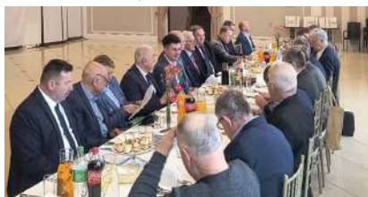
Posiedzenie Komisji Samorządu Spółdzielczego i Promocji ZO KRS w Sokolach.

Już w latach 80. XX wieku SKR Sokóły przejęła w administrowanie gminną biologiczną oczyszczalnię ścieków, która obsługuje dziś ok. 1000 gospodarstw indywidualnych z sześciu gmin. Obok usług asenizacyjnych SKR zajmuje się także konserwacją wodociągów na terenie Gminy Sokóły. Do dyspozycji mieszkańców są trzy brygady szybkiego reagowania w razie awarii.