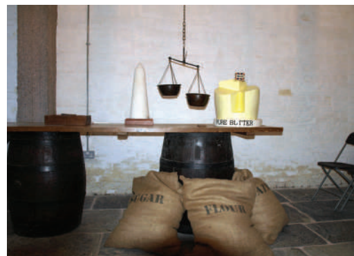
Rochdale Pioneers Museum, rekonstrukcja pierwszego sklepiku Tkaczy z Rochdale.