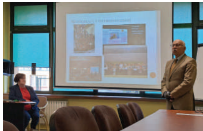
Spotkanie w Delegaturze ZLSP w Krakowie

także o wyzwaniach, przed którymi stoją zwłaszcza małe spółdzielnie pracy. Zwrócono uwagę na potrzebę opracowania lepszych, nowoczesnych rozwiązań prawnych. Międzynarodowy Rok Spółdzielczości ONZ w 2025 roku, powinien sprzyjać podejmowaniu wyzwań legislacyjnych i trosce o poprawę otoczenia prawnego spółdzielczości.