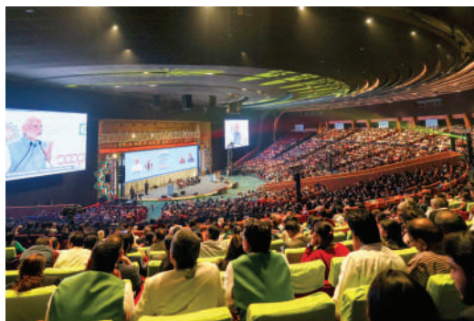
Pierwszy dzień obrad Światowej Konferencji Spółdzielczej - przemawia Premier Indii Narendra Modi.

Dziękując za otrzymaną nagrodę laureat powiedział: - Jestem głęboko wdzięczny i zaszczycony otrzymaniem tej prestiżowej nagrody. To wyróżnienie należy się nie tylko mnie, ale całej rodzinie IFFCO, której poświęcenie i ciężka praca przyczyniły się do sukcesu spółdzielczości. Ta nagroda motywuje nas do dalszego przekraczania granic i odkrywania możliwości, które przynoszą korzyści społeczności rolniczej i sektorowi spółdzielczemu. Serdecznie dziękuję Międzynarodowemu Związkowi Spółdzielczemu za to wyróżnienie, które inspirowało nas do podtrzymywania i rozwijania ducha spółdzielczości na całym świecie.