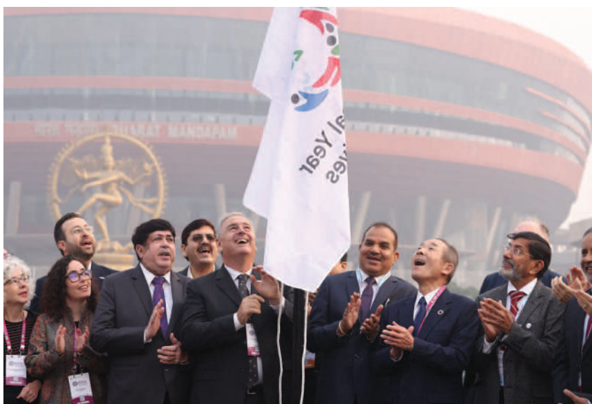
Ariel Guarco Prezydent Międzynarodowego Związku Spółdzielczego wraz z przedstawicielami władz Związku podczas wciągania na maszt flagi Międzynarodowego Roku Spółdzielczego

W dniach 25-30 listopada w stolicy Indii odbyła się Światowa Konferencja Spółdzielcza połączona z inauguracją Międzynarodowego Roku Spółdzielczości 2025, o czym pisaliśmy już w poprzednim numerze Tęczy Polskiej . Teraz możemy podać nieco więcej szczegółów o tym największym spółdzielczym wydarzeniu kończącym się roku.