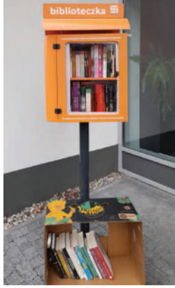
Skrzynki bookcrossingowe to stały element krajobrazu osiedli RSM „Praga”.

lokalnych inicjatyw społecznych i kulturalnych jesteśmy istotnym podmiotem, który nie tylko administruje i utrzymuje zasoby lokalowe oraz zieleni, ale troszczy się także o pozostałe potrzeby mieszkańców.