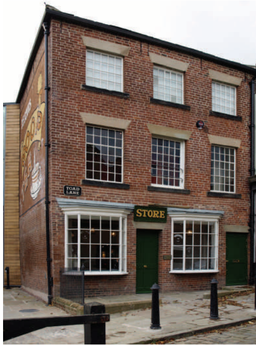
Siedziba Muzeum Pionierów z Rochdale w historycznym budynku przy Toad Lane

Wynajmowano już teraz całą nieruchomości przy Toad Lane, a nie tylko mały lokal sklepowy na parterze. Zagospodarowano podwórze, urządzone magazyny, a w pomieszczeniu na piętrze salę spotkań dla członków. Od 1852 roku w ramach spółdzielni działały warsztaty szewski i krawiecki, uruchomiono własną rzeźnię i piekarnię. Mimo wielu przeżywanego po drodze trudności - spowodowanych m. in. wzrostem bezrobocia w latach 1846-1848, co przyhamowało rekrutację nowych członków i spowolniło jej rozwój, ale także wynikających z wciąż słabych kwalifikacji kupieckich osób kierujących kooperatywą i z częstego wśród nowo przyjmowanych członków braku cechujących pierwotnych założycieli ducha solidarności i bezinteresowności - spółdzielnia odniosła niewątpliwy sukces komercyjny.