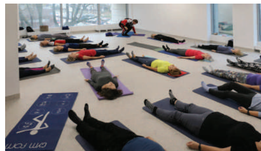
Gimnastyka „Zdrowy kręgosłup” jest bezpłatna dla członków RSM Praga.

Spółdzielnia utrzymuje działalność społeczno - kulturalną z tradycyjnej opłaty kilku groszy z metra wliczonej w czynsz. Jednak dzięki temu, że wciąż buduje, może przeznaczyć na kulturę część zysków z działalności inwestycyjnej. A wcale nie są to małe środki. Dzięki nim gruntownie wyremontowano wszystkie cztery kluby osiedlowe, które dziś mają one nowoczesny wystrój i znakomite wyposażenie. Klub „Kuźnia” na Pradze Północ dysponuje przepiękną salą multimedialną - mogą w niej odbywać się koncerty i spotkania. Na Jagiellońskiej powstała nowa sala konferencyjna, która również służyć będzie wydarzeniom kulturalnym. Pozostałe kluby - „Nasz klub” przy ul. Zamiejskiej na Targówku, „Arkona” w osiedlu „Poraje” na Białołęce oraz „Pinokio”, także na Targówku - to dziś miejsca, do których warto wpaść np. na spotkanie z interesującymi ludźmi, rozmowy o sztuce i kulturze, ale także na tenis stołowy, czy na rozmaite warsztaty manualne. Jesienią i zimą odbywały się zajęcia z tworzenia lampionów i z projektowania biżuterii. W „Naszym klubie” co czwartek spotyka się grupa wykonująca haft krzyżykowy. W klubie „Kuźnia” działa kabaret, w klubie „Pinokio” - chór „Sonorki”, który niedawno obchodził jubileusz 20-lecia. Chór pod kierownictwem profesjonalnego